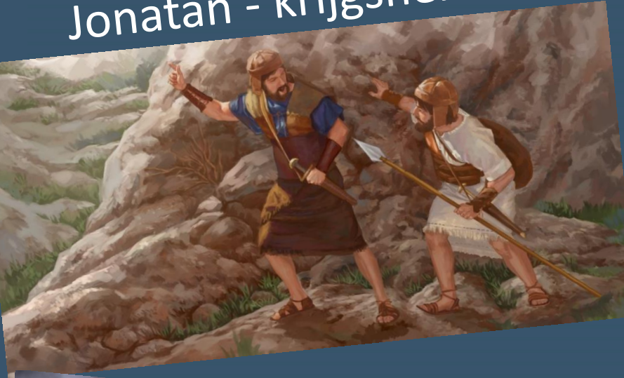
Jonatan - krijgsheld