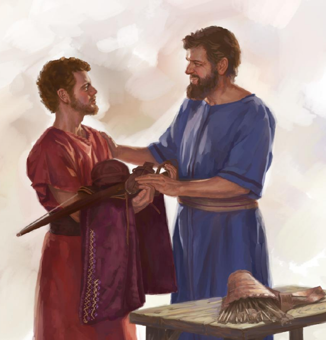
Vriendschapsverbond Jonatan en David