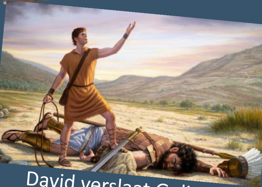
David verslaat Goliath